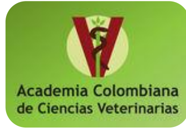
Academia Colombiana de Ciencias Veterinarias