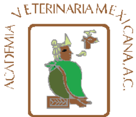
Academia Veterinaria Mexicana